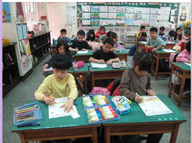
每月 1 主題的品格學習單