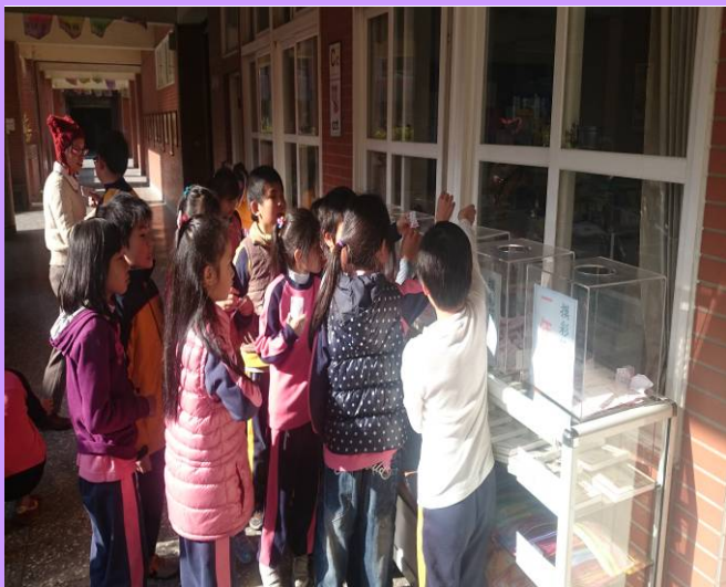
學生踴躍參與品格摸彩活動