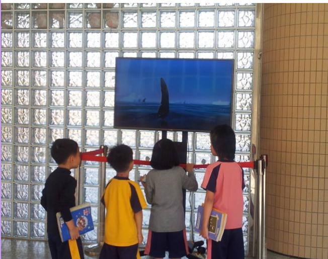
利用下課時間在水晶牆前播放品格小短片