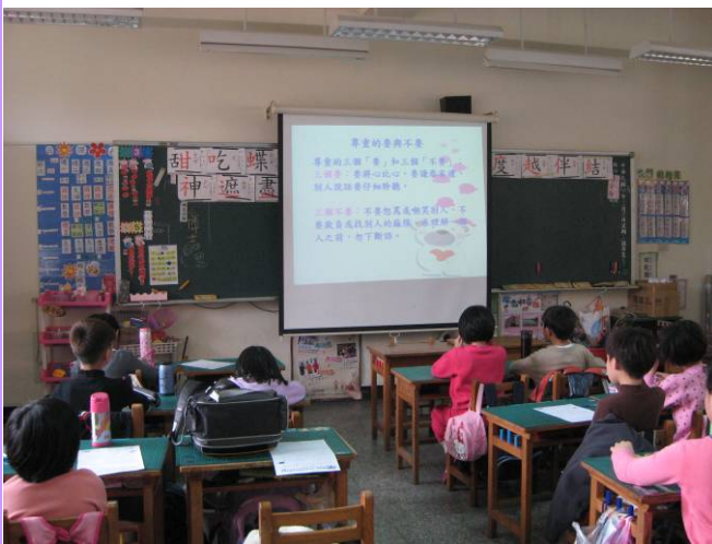
每月播放品格教育小短片