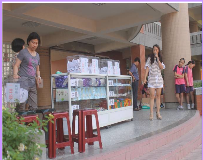
每學期期末舉辦公開摸獎活動