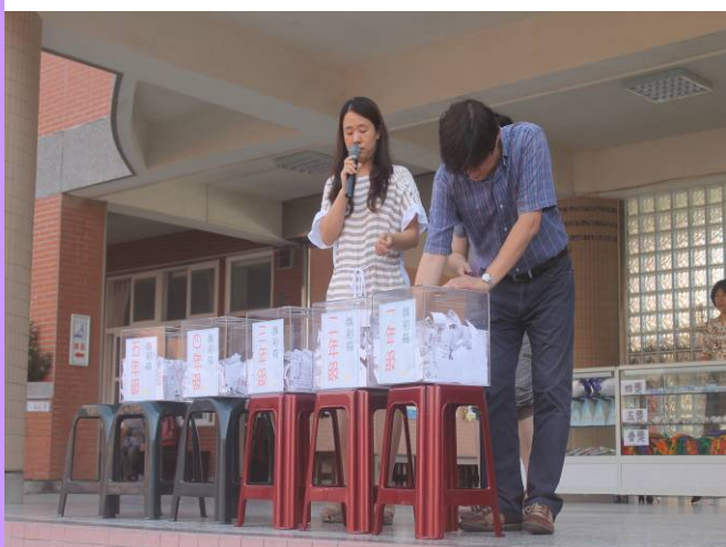
請校長抽出幸運得主