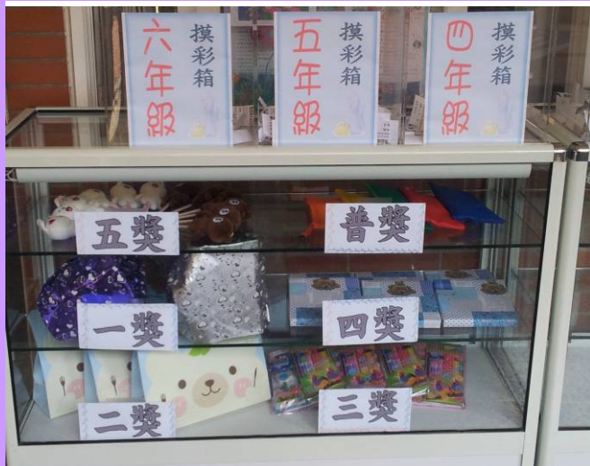
展示品格摸彩的獎品以引起學生參與的動機