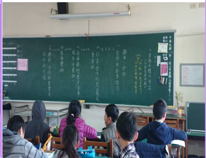
將品格故事融入教學中引導學生思考