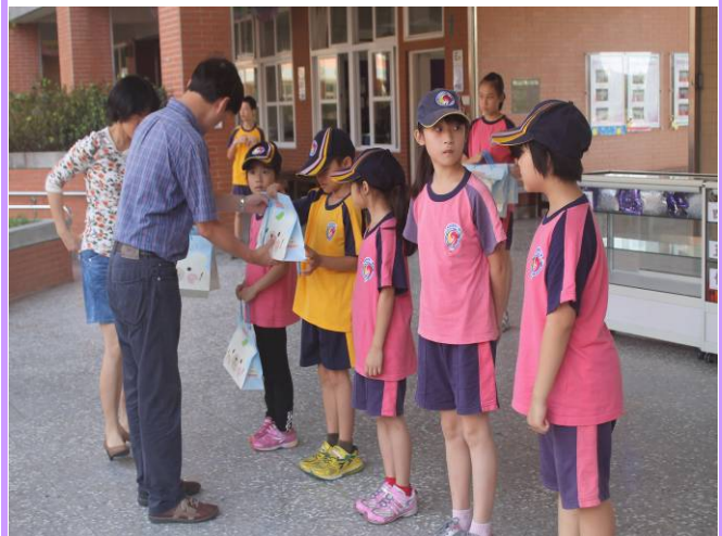
由校長親自頒發獎品給幸運得主