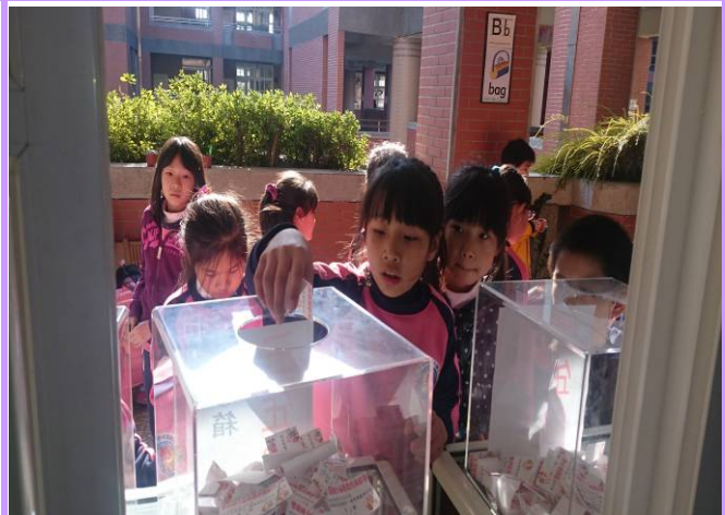
完成品格閱讀單 1 張或集滿 10 張感恩卡就可換一張品格摸彩券